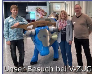
Unser Besuch bei V-ZUG